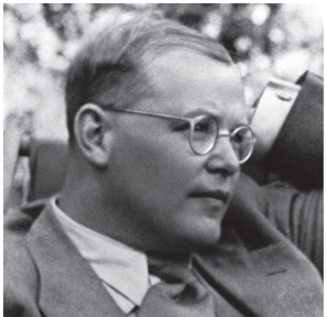
Dietrich Bonhoeffer im Juli 1939

1945 wird Bonhoeffer im KZ Flossenbürg ermordet.